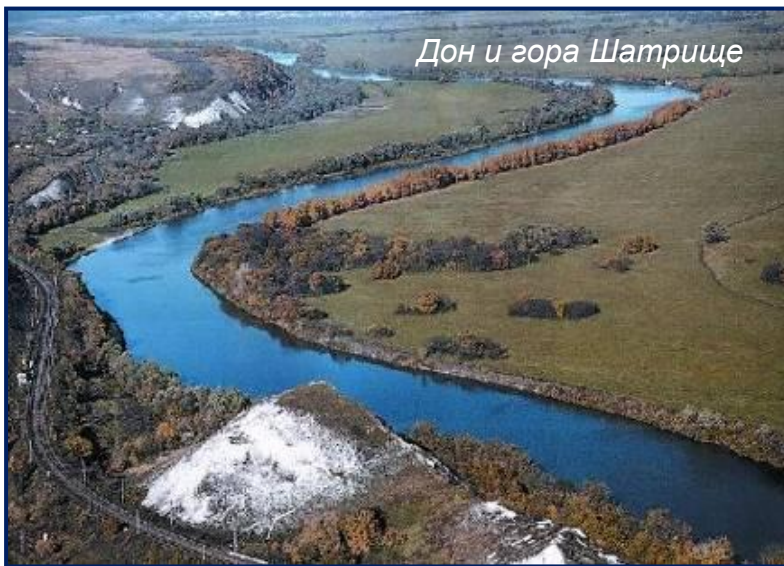
Дон и гора Шатрище