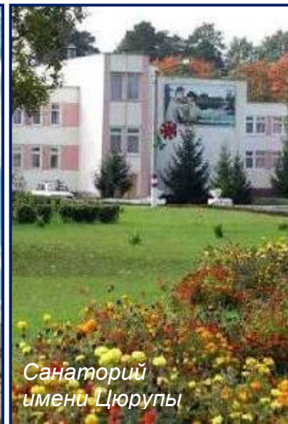
Санаторий имени Дзюрупы