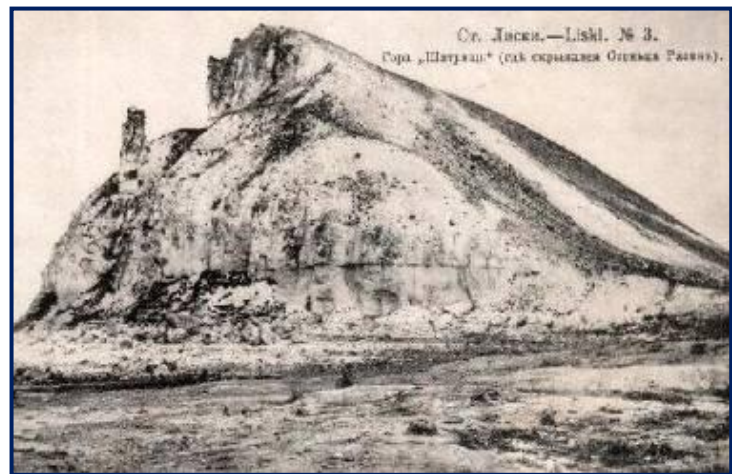
Гора «Шатрище» (где скрывался Степана Разин). Дореволюционная открытка