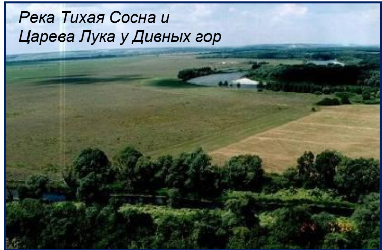
Река Тихая Сосна и Царева Лука у Дивных гор