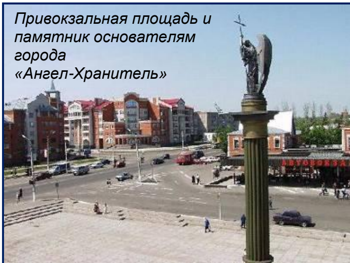
Привокзальная площадь и памятник основателям города «Ангел-Хранитель»