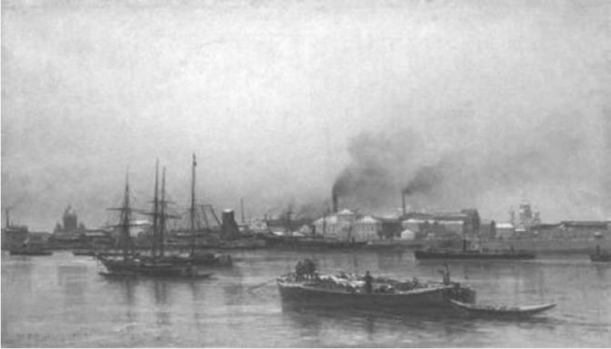
А. К. Беггров. Набережная Невы. 1876 г.