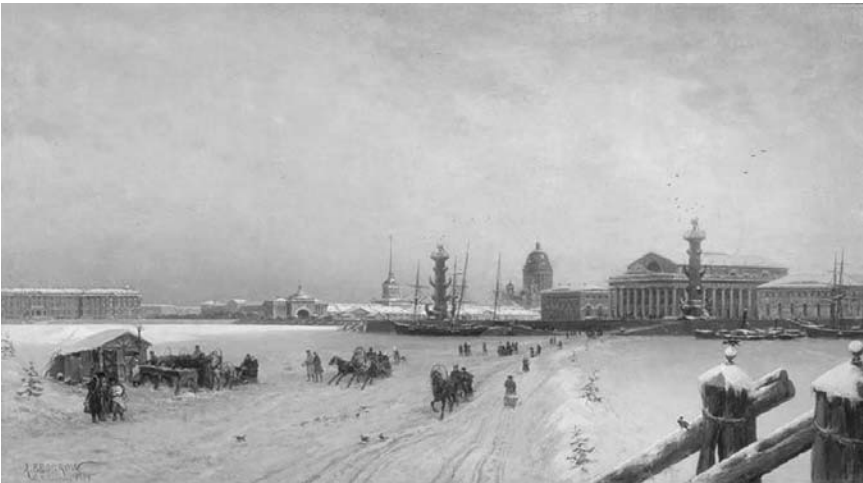
А. К. Беггров. Вид Невы и Стрелки Васильевского острова с Фондовой биржей. 1879 г.