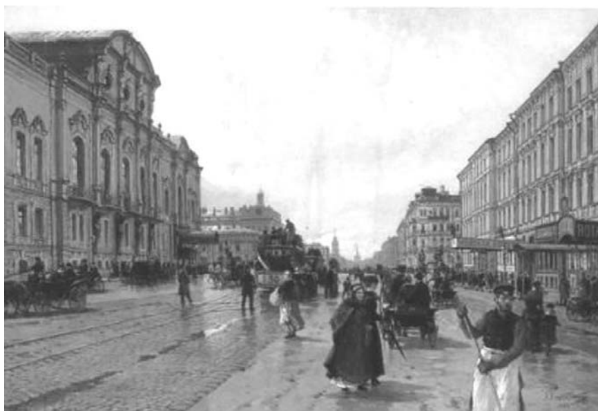
А. К. Бегров. Утро на Невском проспекте. 1880 г.

После того как А. К. Бегров сменил А. П. Боголюбова в должности художника Морского ведомства, основными жанрами его творчества стали морские виды, изображения гаваней, портов, набережных, а также «портреты» кораблей (императорские яхты «Цесаревна», «Дагмара», «Славянка»). Кроме того, его кисти принадлежат и городские пейзажи. В Музее истории Петербурга хранится его полотно «Утро на Невском проспекте». На выставке «Старый Петербург» в Русском музее в ноябре 2003 г., кроме вышеуказанной картины, экспонировались: «Николаевская набережная», «Панорама Невы от Николаевского моста», «Судостроительная верфь Новое Адмиралтейство».