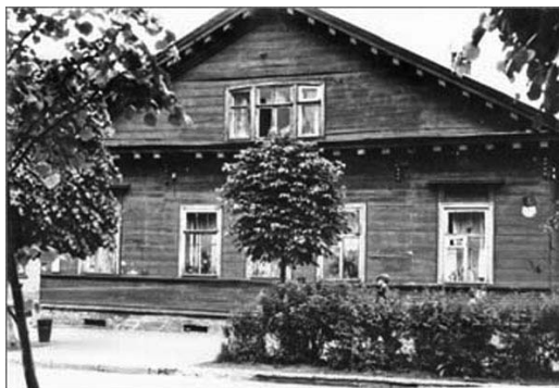
Гатчина, Соборная ул., 8