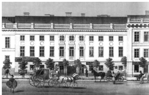
Невский пр., 62