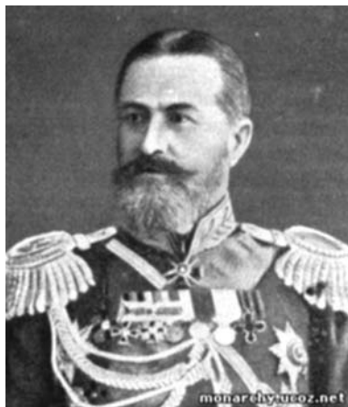
Генерал от инфантерии А. Ф. Забелин

Наиболее полные сведения удалось получить из Российского государственного исторического архива в Санкт-Петербурге об Александре Федоровиче Забелине. В фонде «Кабинета его Императорского Величества» хранится дело генерал-лейтенанта А. Ф. Забелина, что