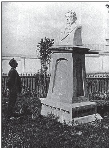
Первый бюст великого поэта, установленный в 1905 г. на двухметровом постаменте из оштукатуренного кирпича. Скульптор Вадим Рейтлингер. Постамент начал разрушаться, гипсовый бюст демонтировали в середине 30-х гг. XX века.

послужили рассказы местных жителей, услышанные им на обратном пути из Уральска в Болдино. Нам удалось установить, что источником явилась книга Ф. Антинга «Жизнь и военные деяния... Суворова...», издания 1799 года. Эта книга хранится и была прочитана нами в Музее книги при Российской Государственной библиотеке. Вот эти эпизоды в изложении Антинга. – «Здесь (в Мостах – А.Н.) команда имела отдохновение. Недалеко от дома, где содержался Пугачёв под караулом, случился пожар. Несколько дворов выгорело, и пока огонь погасили, весьма прилежно должно было присматривать, чтобы он при сем замешательстве не скрылся.