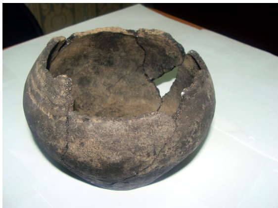
24. Керамический сосуд V века до н.э., найденный в 2010 г. на месте строительства пристройки к Национальной библиотеке им. Н.Г. Доможакова.